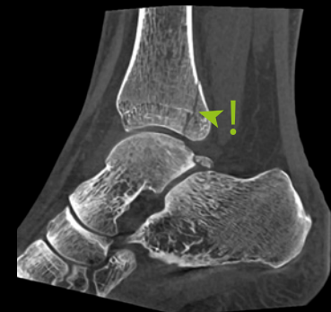
DVT · Sagittaler Schnitt